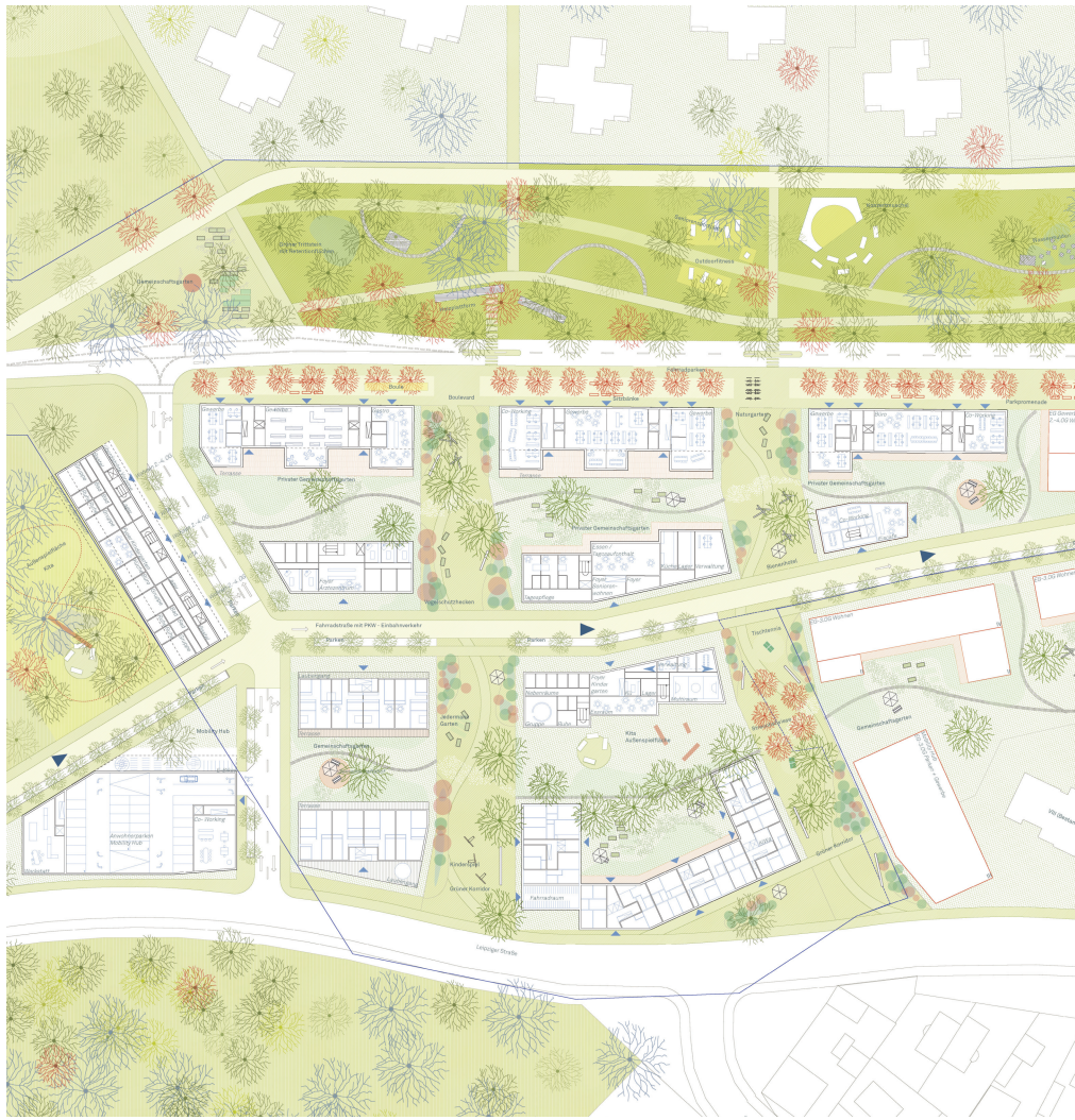
Grundriss Wohnen im Grünen M 1:500