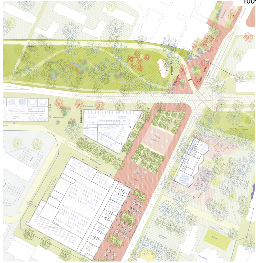
Grundriss Marktplatz und Bibliothek M 1:500