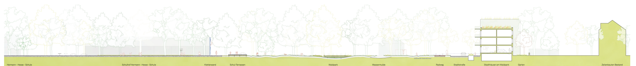
Schnitt C-C M 1:200 Hermann-Hesse-Schule, Schulhof Hermann-Hesse-Schule, Kletterwand, Schul-Terrassen, Waldpark, Wassermulde, Radweg, Stadtstraße, Stadthäuser am Waldpark, Garten, Zeilenbauten Bestand