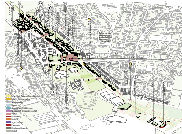
Nutzungsverteilung | M o.M.