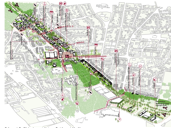
Grün- und Freiflächenkonzept, Nutzung Freiräume | M o.M.