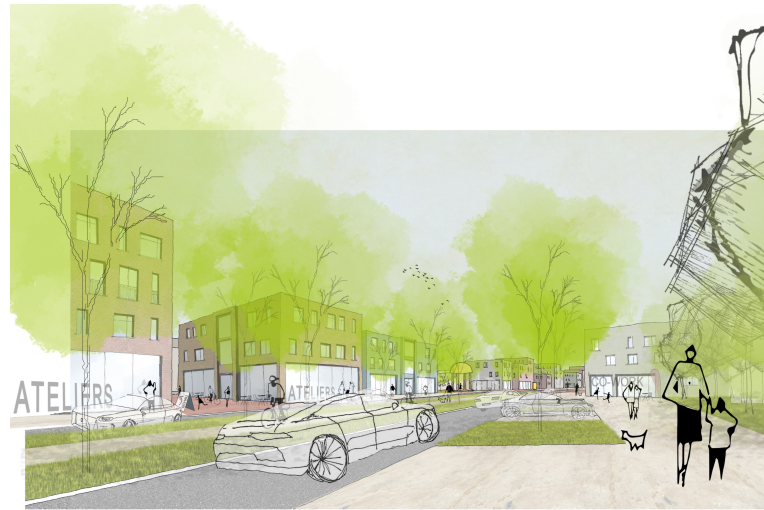
Räumliche Skizze | Bewegungsraum B448