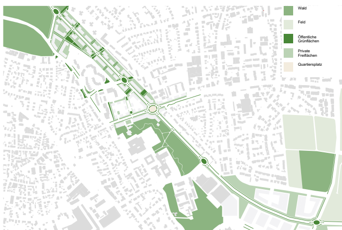
Grün- und Freiraumkonzept 1:5.000