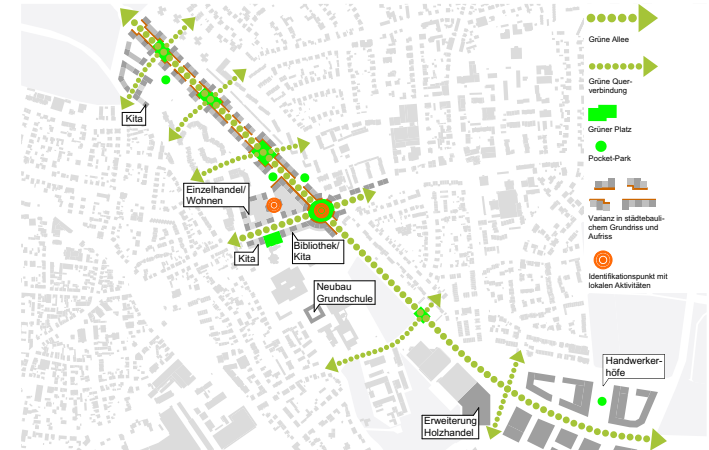
Räumliche und funktionale Leitidee 1:5.000