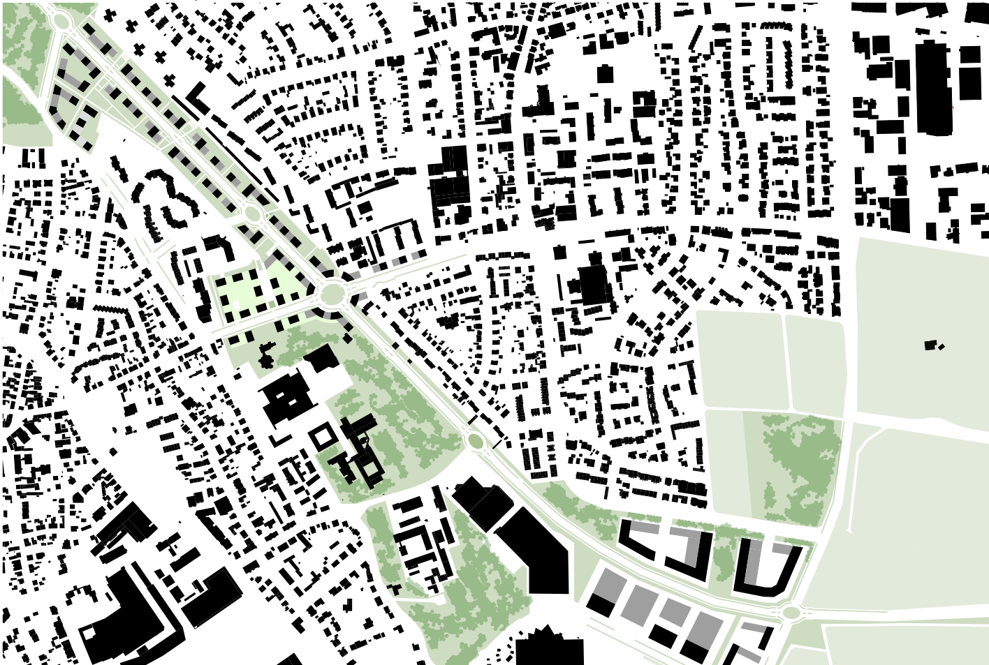
Schwarzplan mit Grünkonzeption 1:2.500